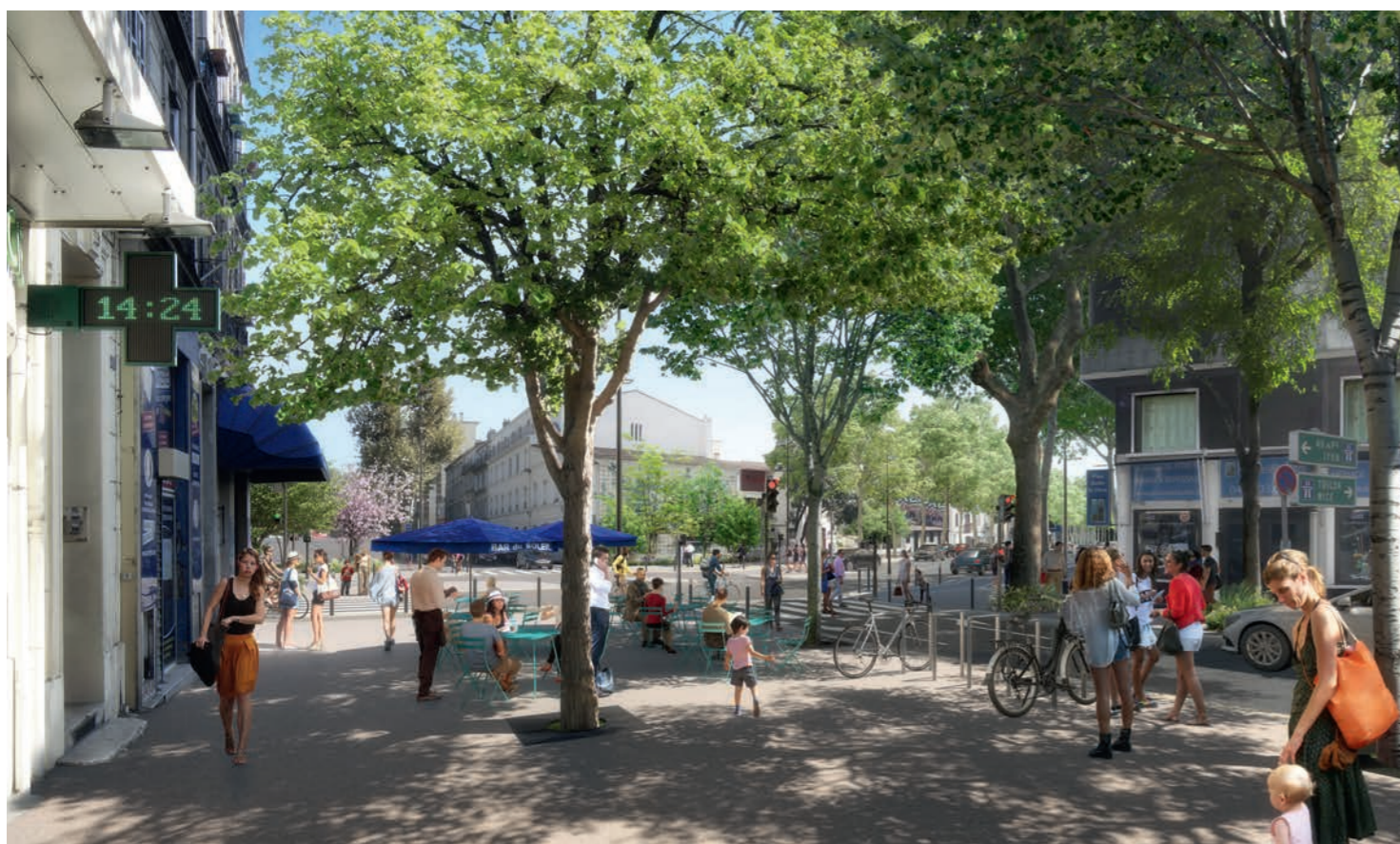
Place Pierre Brossolette