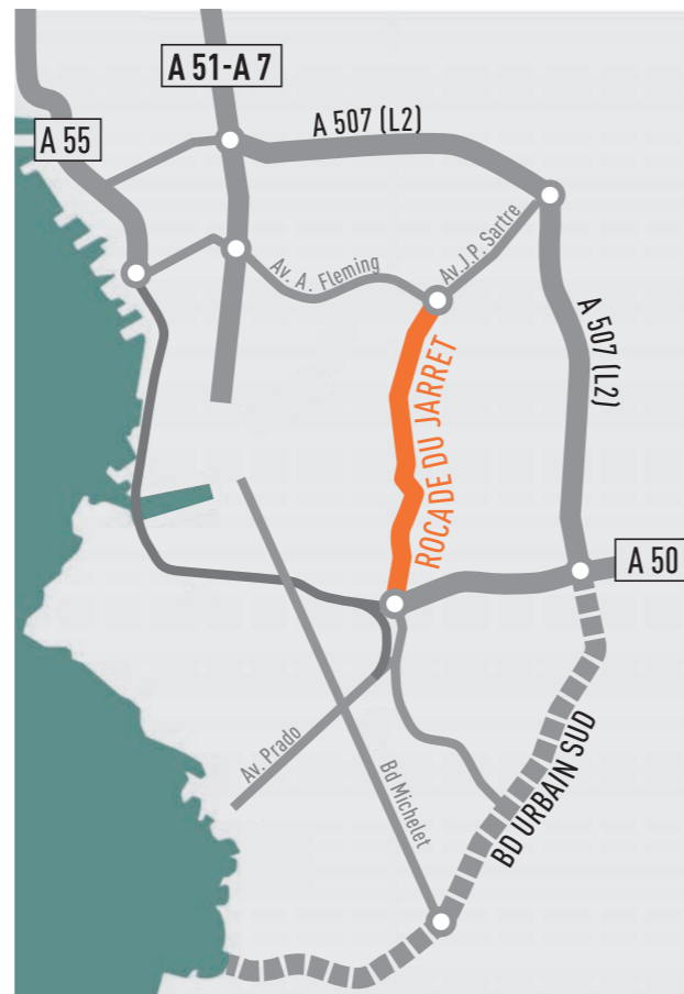
La rocade du Jarret dans la trame circulatoire

La mise en service de la L2 en octobre 2018 permet de délester le trafic de la Rocade du Jarret et ainsi de requalifier la rocade suivant un parti d'aménagement plus urbain, sous la forme d'un boulevard multimodal qui a pour objectifs principaux de garantir un trafic fluide, une circulation efficace des transports en commun, des aménagements cyclables continus et des espaces publics de qualité.