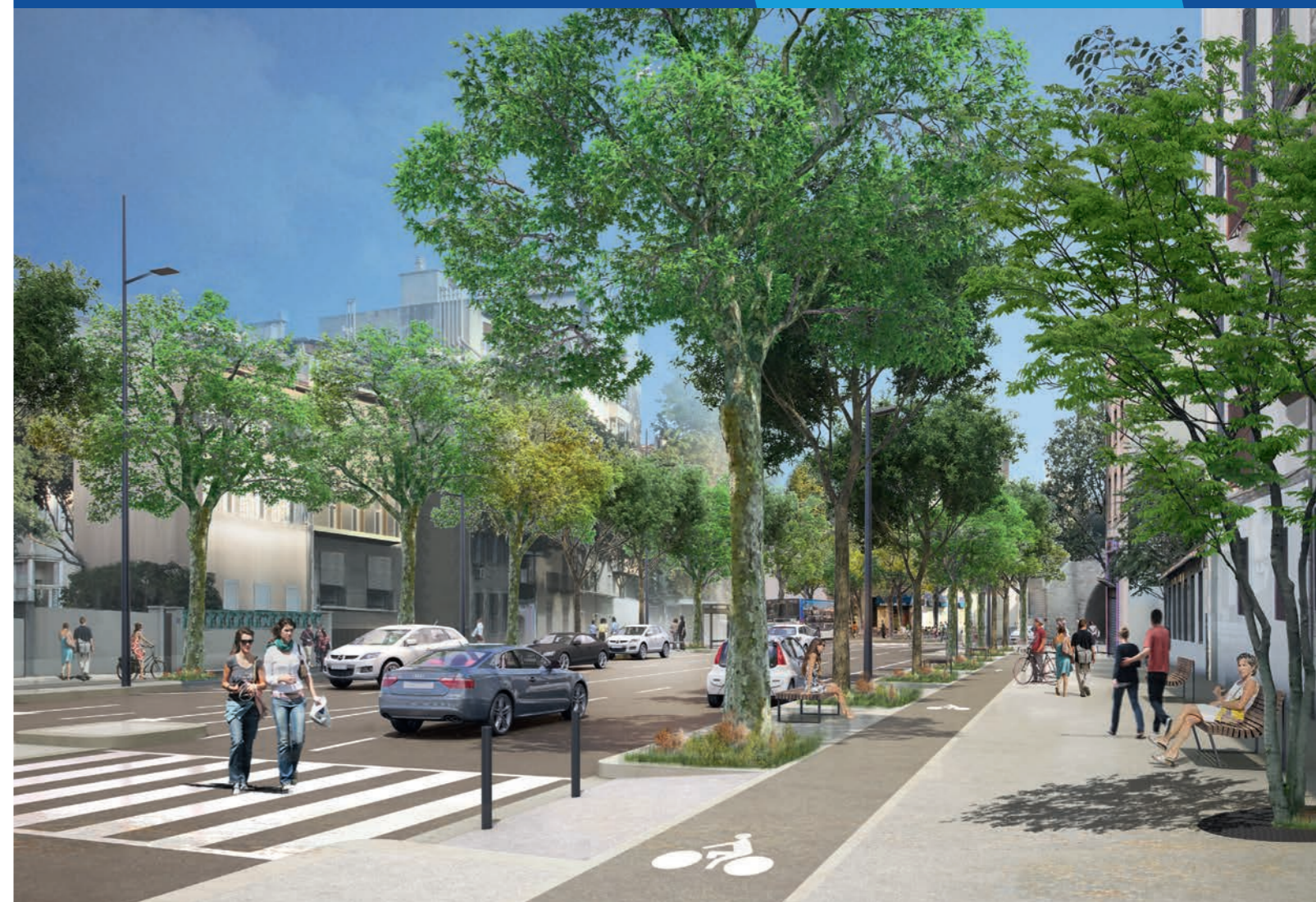
Section 3 : Françoise Duparc