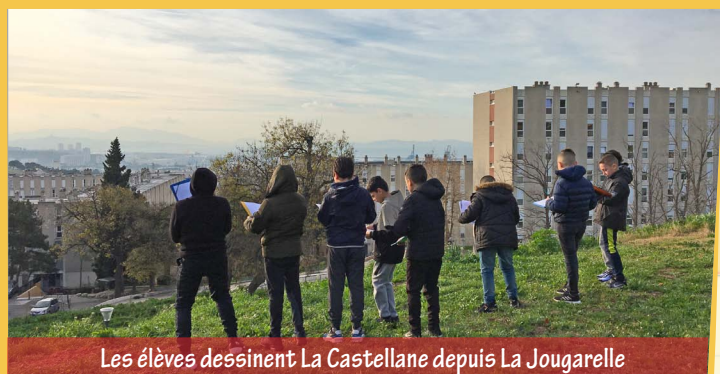
Les élèves dessinent La Castellane depuis La Jougarelle

Nous avons découvert l'histoire du quartier : avant la construction de La Castellane en 1969 et de La Bricarde en 1972, il n'y avait que des champs ! Les bâtiments ont été construits en béton dans le style de l'époque. Aujourd'hui, ils ont besoin d'être réhabilités, c'est-à-dire améliorés par des travaux « pour être plus confortables ».