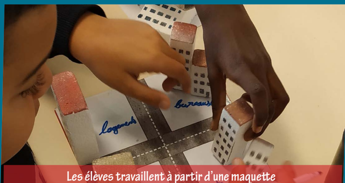
Les élèves travaillent à partir d'une maquette

Qu'est-ce qu'une ville ? Quels types de bâtiments sont nécessaires pour bien y vivre ? Des logements, mais pas que... En regardant le quartier de plus près, on s'aperçoit qu'il manque d'équipements culturels, de commerces, des bureaux. C'est le travail de l'urbaniste : il étudie la ville, la réorganise et dessine le plan du futur quartier.