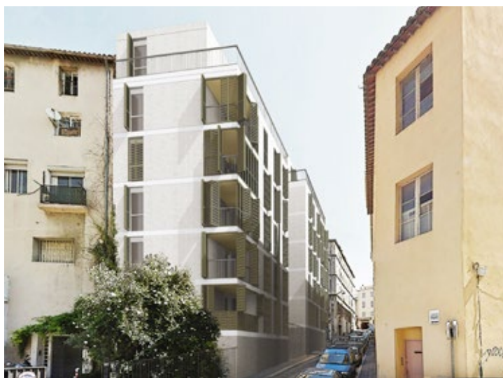
F Création 54 logements sociaux, Résidence ARGO, Angle Fauchier-Malaval / Ametis et Logirem / 2019 (Architecte : Rudy Ricciotti)