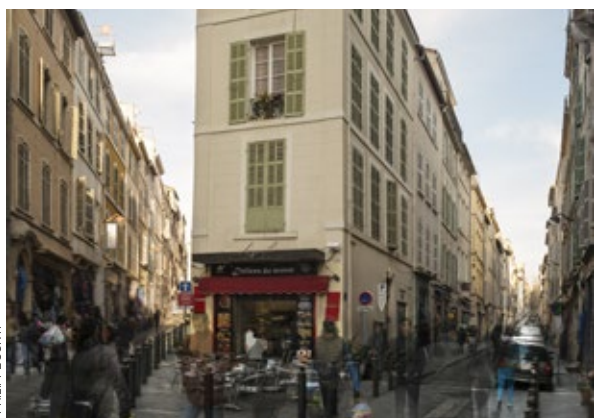
C Réhabilitation 14 logements, 1 & 7-9 rue Saint-Théodore / Habitat Marseille Provence / 2017