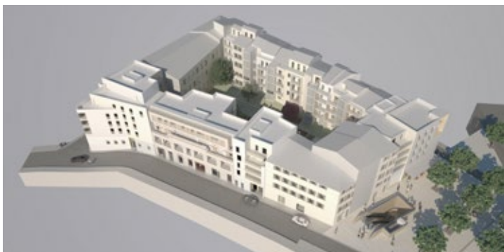
G Création 9 logements sociaux, « Faubourg des Fiacres » / îlot Fiacres-Duverger, 2, rue Duverger / Logirem / EPAEM / En cours (Architecte : Atelier Kern)