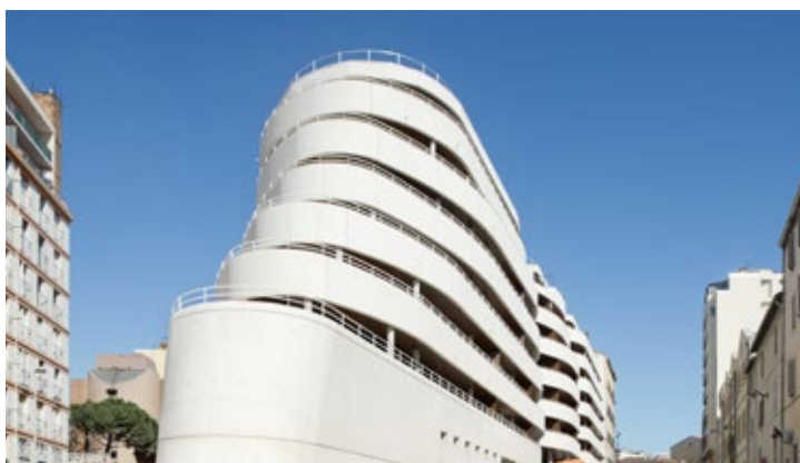
E Création 26 logements sociaux, 35 rue Thubauneau / ADOMA / 2016