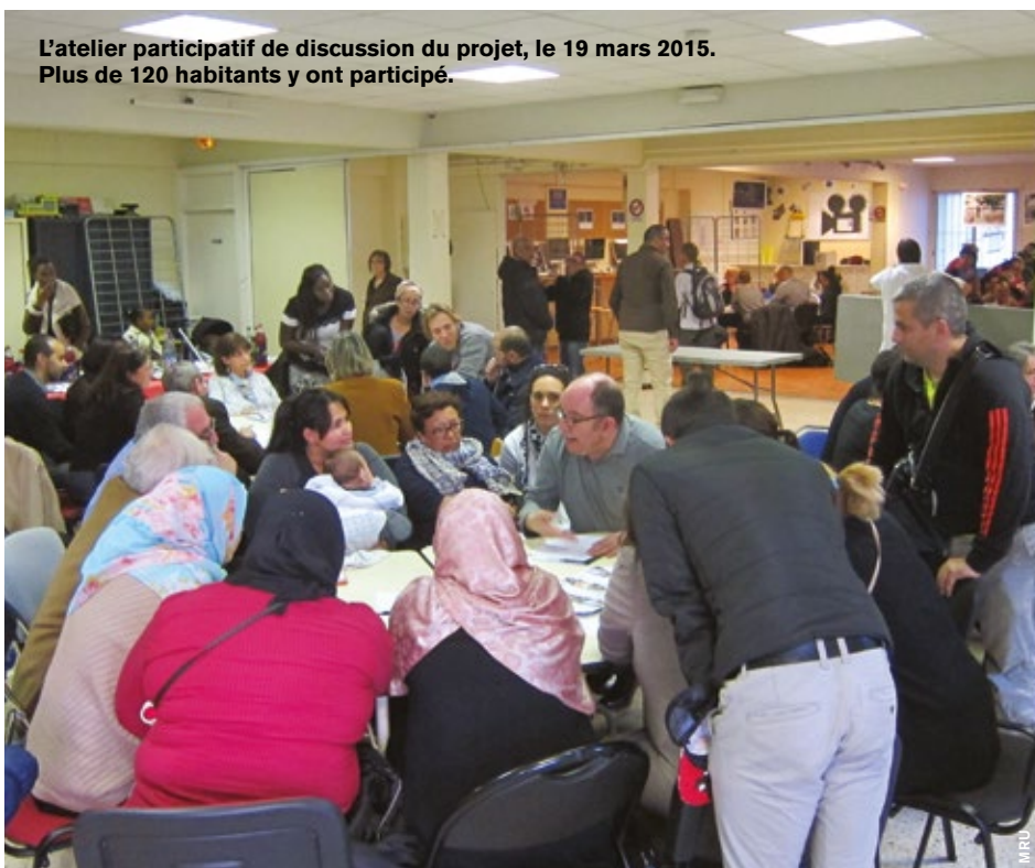
L'atelier participatif de discussion du projet, le 19 mars 2015. Plus de 120 habitants y ont participé.

Une grande réunion de lancement de la concertation a rassemblé, en mars 2015, plus d'une centaine de personnes. Les débats se sont poursuivis avec une série d'ateliers thématiques autour des questions de mobilité, d'emploi et de vie de quartier. Ces rendez-vous ont permis aux habitants de faire valoir leurs points de vue et de proposer des pistes concrètes d'évolution, dans chaque domaine. Des comptes rendus ont été diffusés aux participants, mais aussi aux techniciens, afin de préparer les ateliers suivants. Même si toutes ces attentes ne peuvent être prises en compte, la participation est aussi