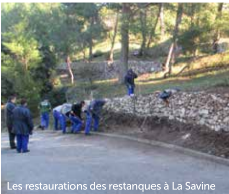
Les restaurations des restanques à La Savine

Lorsqu'on parle d'insertion, on présente souvent les avantages du dispositif d'embauche. Plus rarement les améliorations que les différents chantiers ont induites, pour tous, sur le quartier.