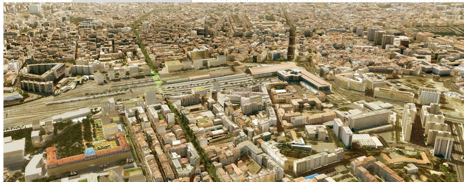
La gare résolument tournée vers les casernes réaménagées et la Belle de Mai.

Rendez-vous ! pour la réunion publique le lundi 19 sept. 2016 à 18h à la Friche de la Belle de Mai en présence de l'équipe d'architectes urbanistes lauréate. Venez nombreux.