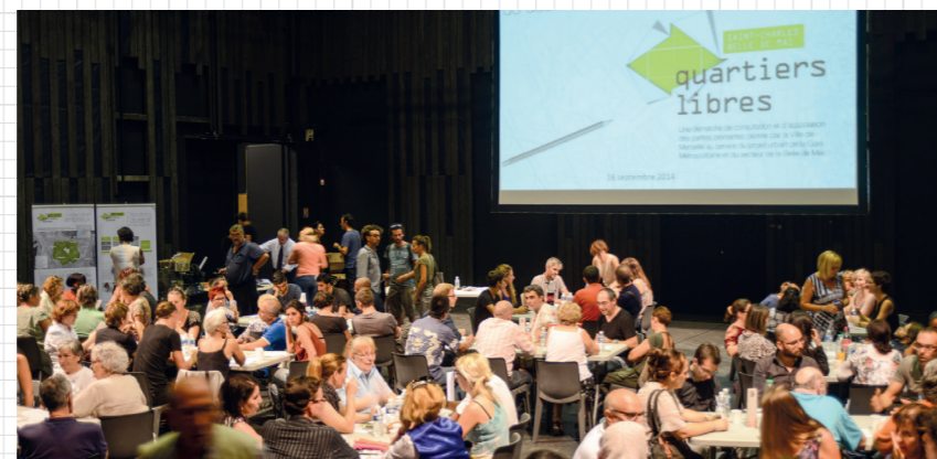
Atelier participatif en septembre 2014 à la Friche Belle de Mai