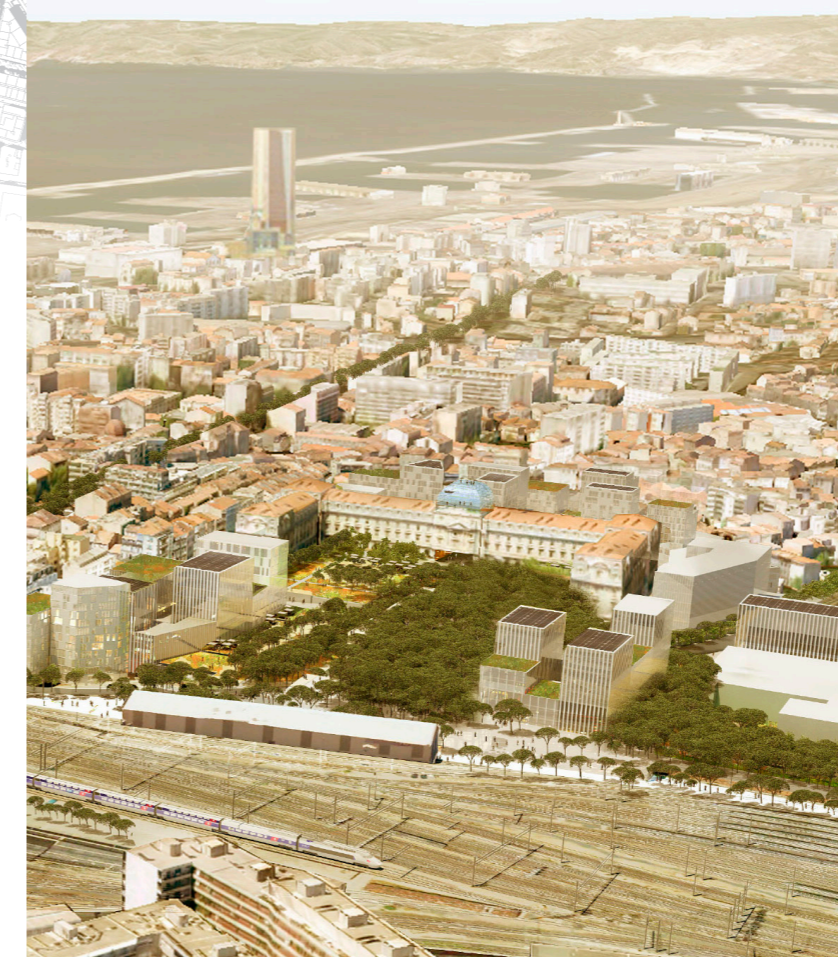
Première esquisse du projet urbain Quartiers Libres

Ce projet emblématique de la ville de Marseille avance et continuera d'avancer avec vous !