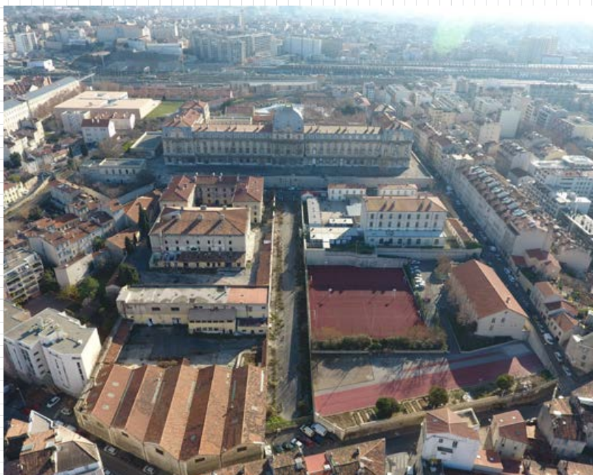
Au cœur du secteur Quartiers Libres, les casernes abriteront le futur groupe scolaire Marceau.

Un deuxième groupe scolaire d’une capacité maximale de vingt classes est à l’étude sur un terrain situé rue Loubon. Cette localisation vient compléter le maillage scolaire en place dans le quartier.