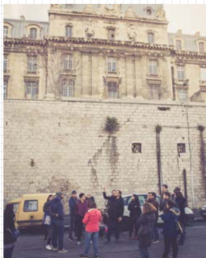
Visite du site des casernes avec la Ville de Marseille et les habitants.