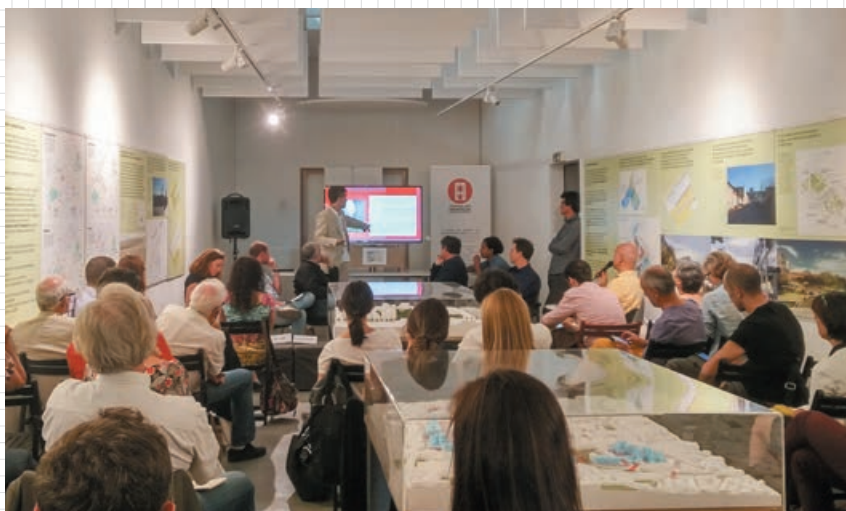
Le 8 juin dernier, la Ville de Marseille, l’équipe Güller Güller - TVK et la délégation EUCANET au Syndicat des Architectes des Bouches-du-Rhône.