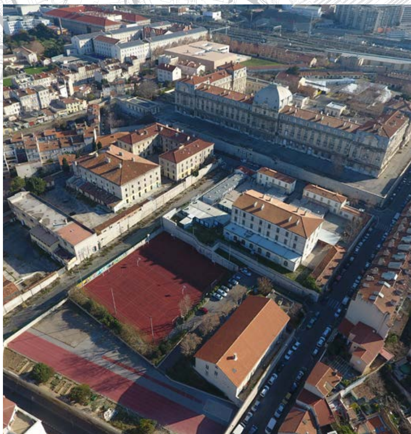
Vue aérienne du site des casernes.