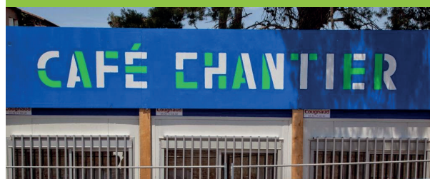
Café Chantier - la cayolle

Nous réfléchirons ensemble à sa forme, à l'endroit où l'implanter mais aussi aux manières de le faire vivre.