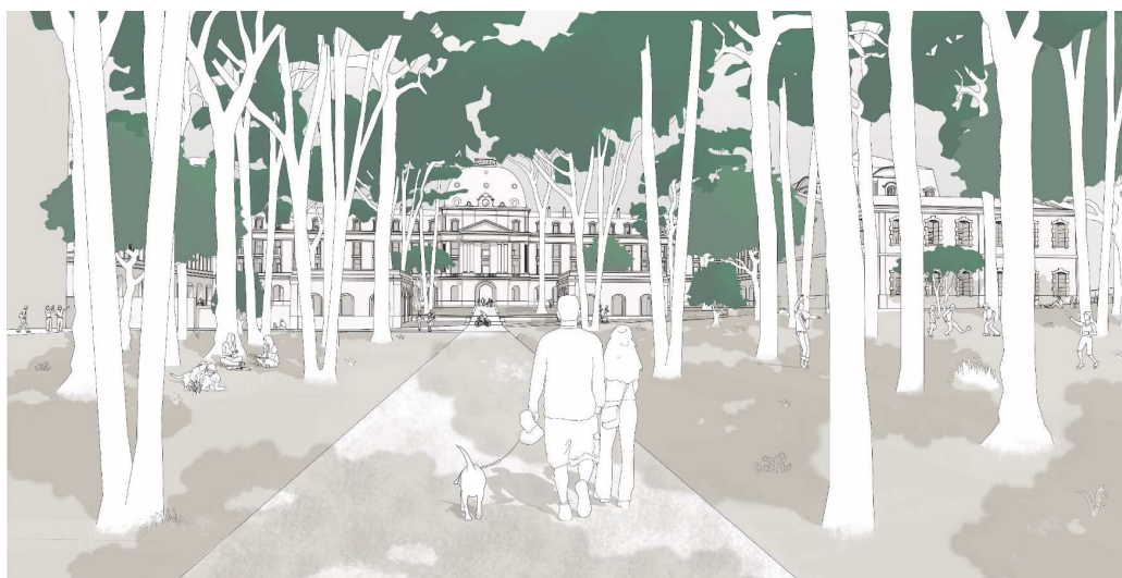
Illustration de la Forêt du Muy projetée.