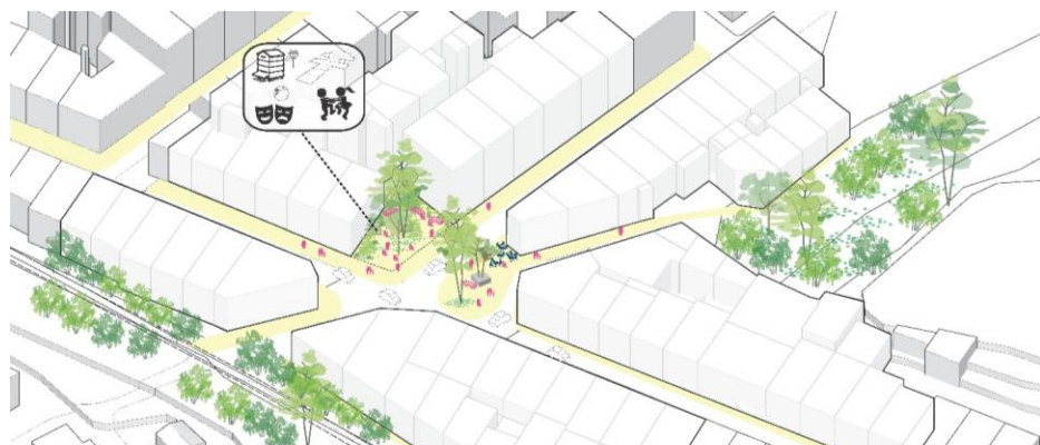
Proposition du groupement pour la place de poche Clovis Hugues/Bernard/Levat (Crédit : Güller Güller/TVK).