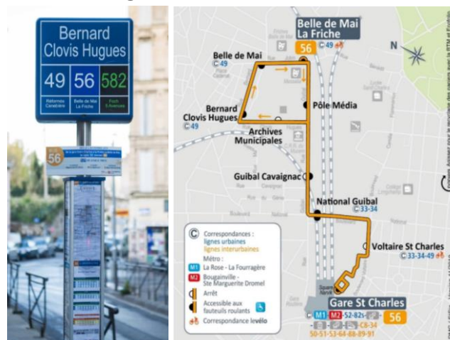
A gauche : un des arrêts de la L56 ; A droite : plan de circulation de la L56