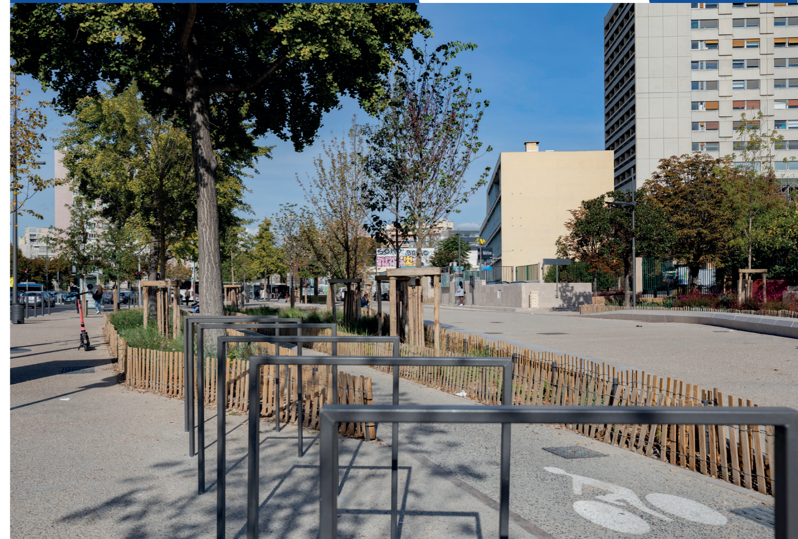
Réalisation des aménagements du parvis de l'entrée de l'hôpital de La Timone