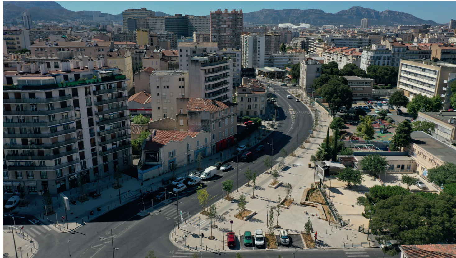
Aux abords du square Sidi Brahim, aménagements du Boulevard Sakakini