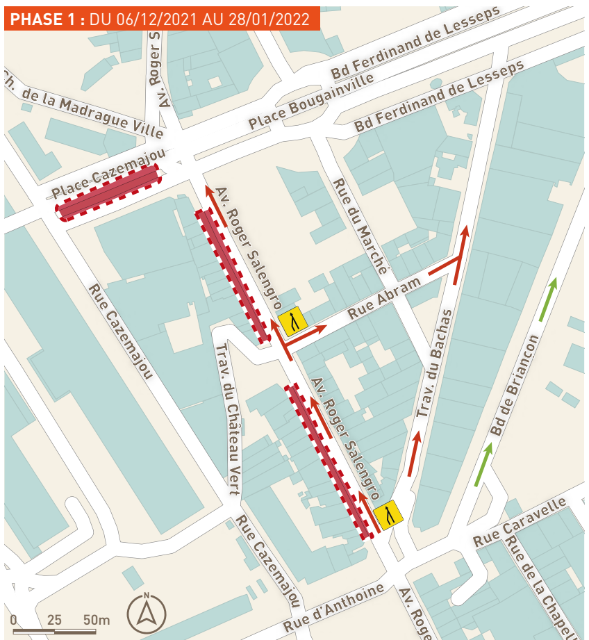
Schéma de circulation © Aix-Marseille-Provence Métropole - Pôle Infrastructures